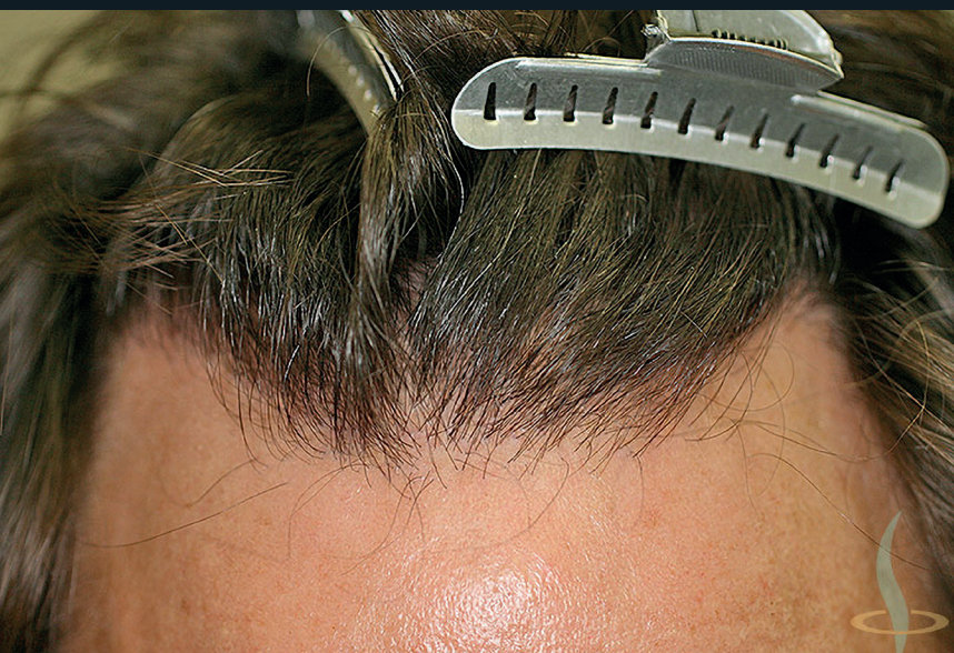
Before – After New natural hairline instead of a receding hairline.