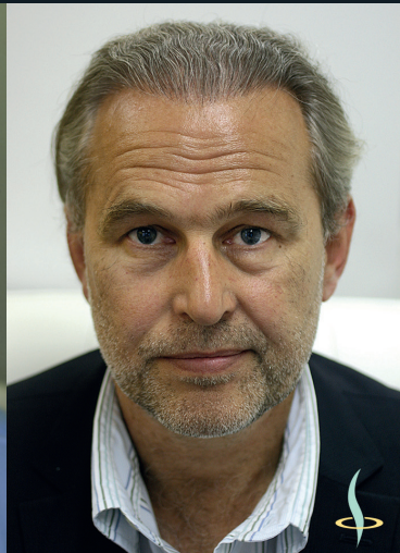
Before – After 3 operations – 2800 Grafts ~11.200 hair follicles