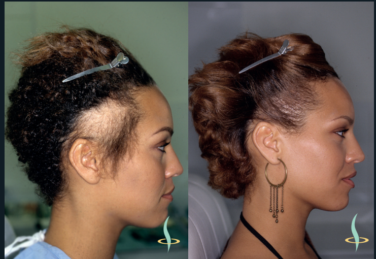
Before – After 1 operation – 130 Grafts ~700 hair follicles

hair, nor artificial hair implants meet the aesthetic expectations of my clients. What's more, in the case of synthetic hair, there is a significant health risk, so this practice has been banned in the US since 1983.