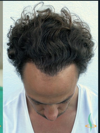
Before – After 3 operations – 2930 Grafts ~13.500 hair follicles